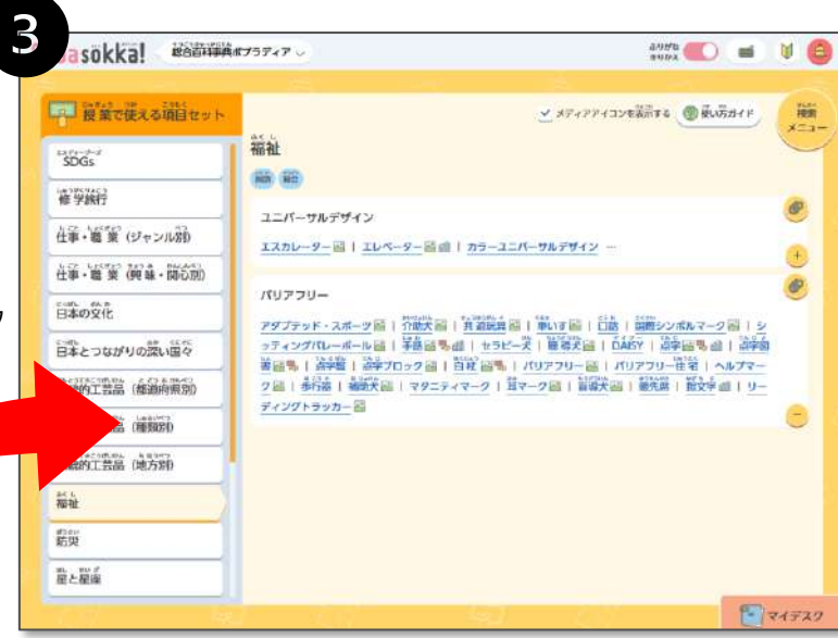
▲【授業で使える項目セット】> 福祉を選択