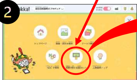
▲「授業で使える項目セット」ボタンをクリック