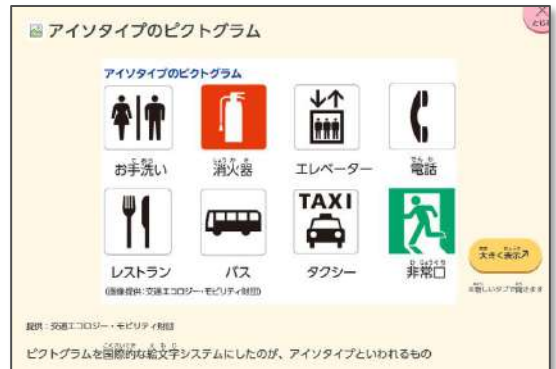
▲項目「ユニバーサルデザイン」の【画像・資料の例】