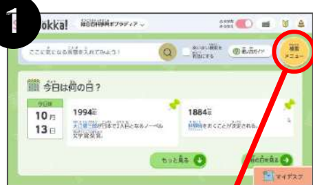
▲トップページ画面より 右上の「検索メニュー」ボタンをクリック

【授業で使える項目セット】には、福祉のテーマがあり、「ユニバーサルデザイン」と「バリアフリー」に関連した項目をまとめて調べることができます。